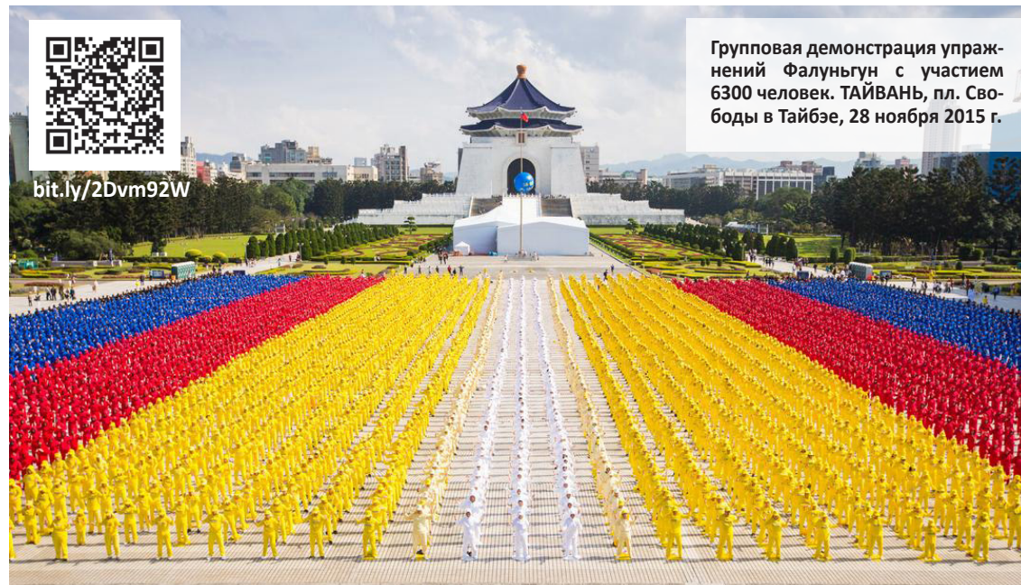
Групповая демонстрация упражнений Фалуньгун с участием 6300 человек. ТАЙВАНЬ, пл. Свободы в Тайбэе, 28 ноября 2015 г.

На Тайване с помощью опросника SF-36 экспертная комиссия сделала выводы, что респонденты, практиковавшие Фалуньгун, были физически и психически здоровее, чем всё тайваньское население в целом.